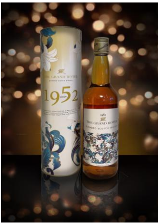
圓山 1925 威士忌 售價$1150