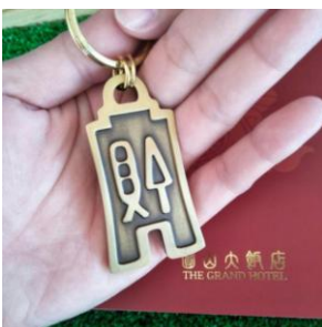
圓山貨布鑰匙牌 售價$500