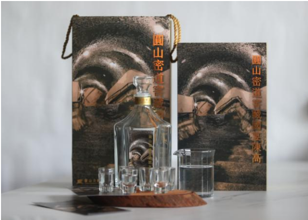
圓山密道窖藏陳高 售價$2500